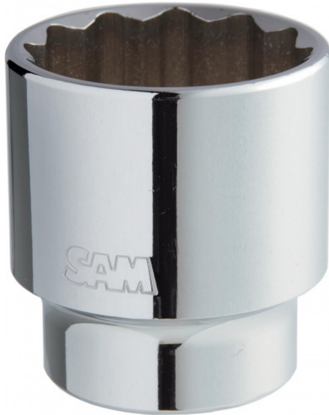
Dop 3/4 12 kant-mm C-...Douilles_3/4_MM